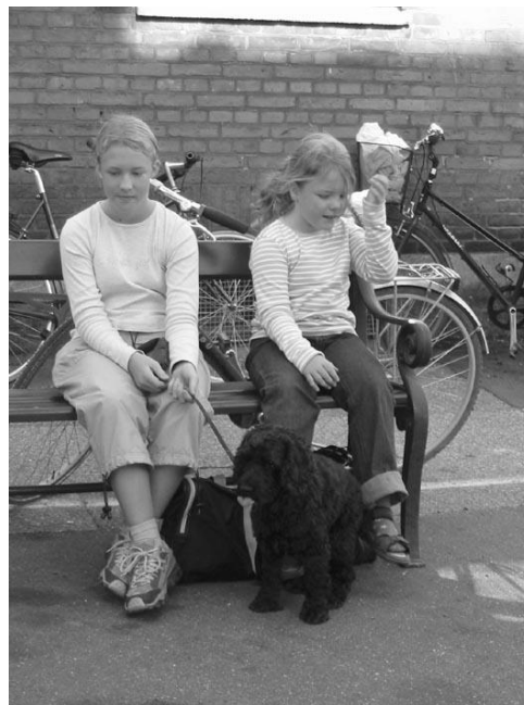
Ophold på pladsen