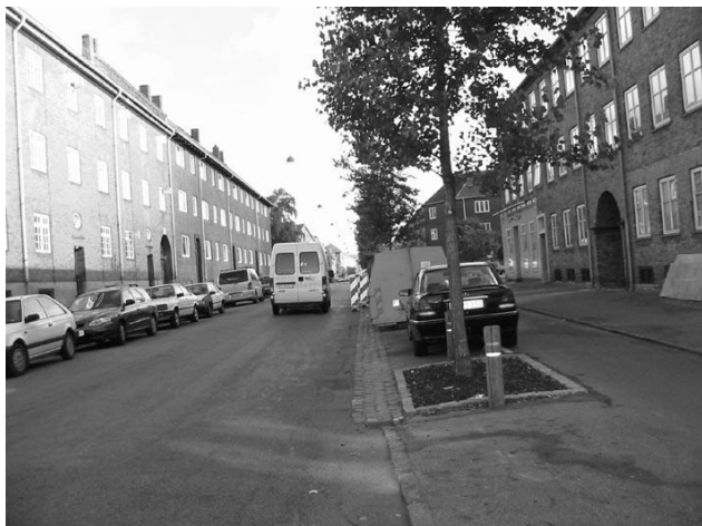
Indsnævring på Mågevej