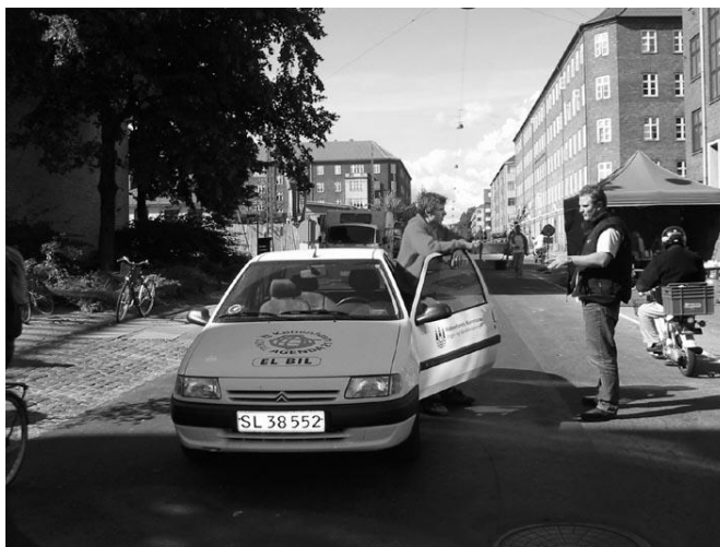
El-bil på pladsen ved Ørnevej

Medierne spillede her en vis rolle for kendskabet. Men de opstillede stoppesteds-skilte betød mere, og stod i sig selv for den største enkeltfaktor, der gav kendskab til projektet.