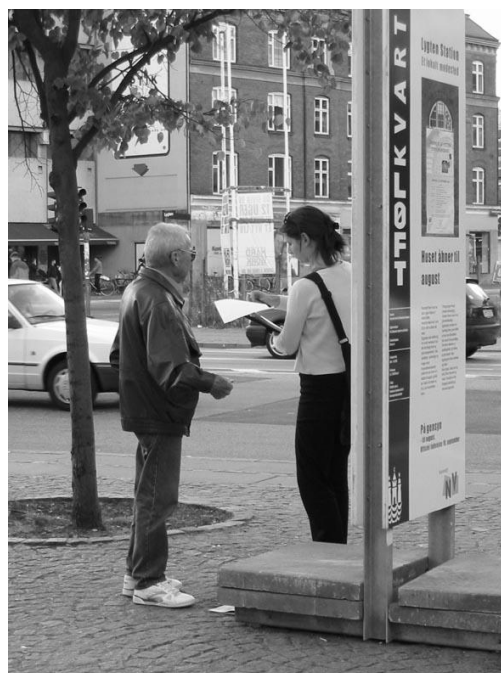
Der interviewes på Lyngsies Plads