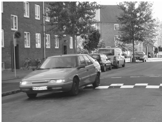
Bump på Mågevej

Projektet bestod i bump og et stykke cykelbane på Mågevej ved Rørsangervej og vejindsnævringer på strækningerne mellem Nattergalevej og Ørnevej hhv. Kærsangervej og Tornsangervej. Formålet var at få bilerne til at køre langsommere og derved gøre det mere trygt og sikkert at gå og cykle i området. Bumpene blev anlagt allerede inden Miljøtrafikugen.