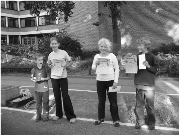
Vindere af børnedyrskue afholdt på pladsen