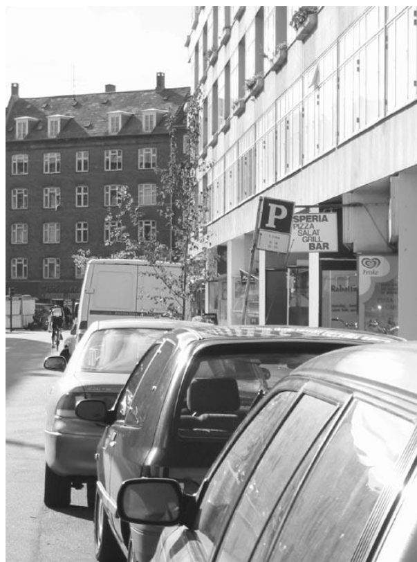
Grøn parkering på Frederiksborgvej